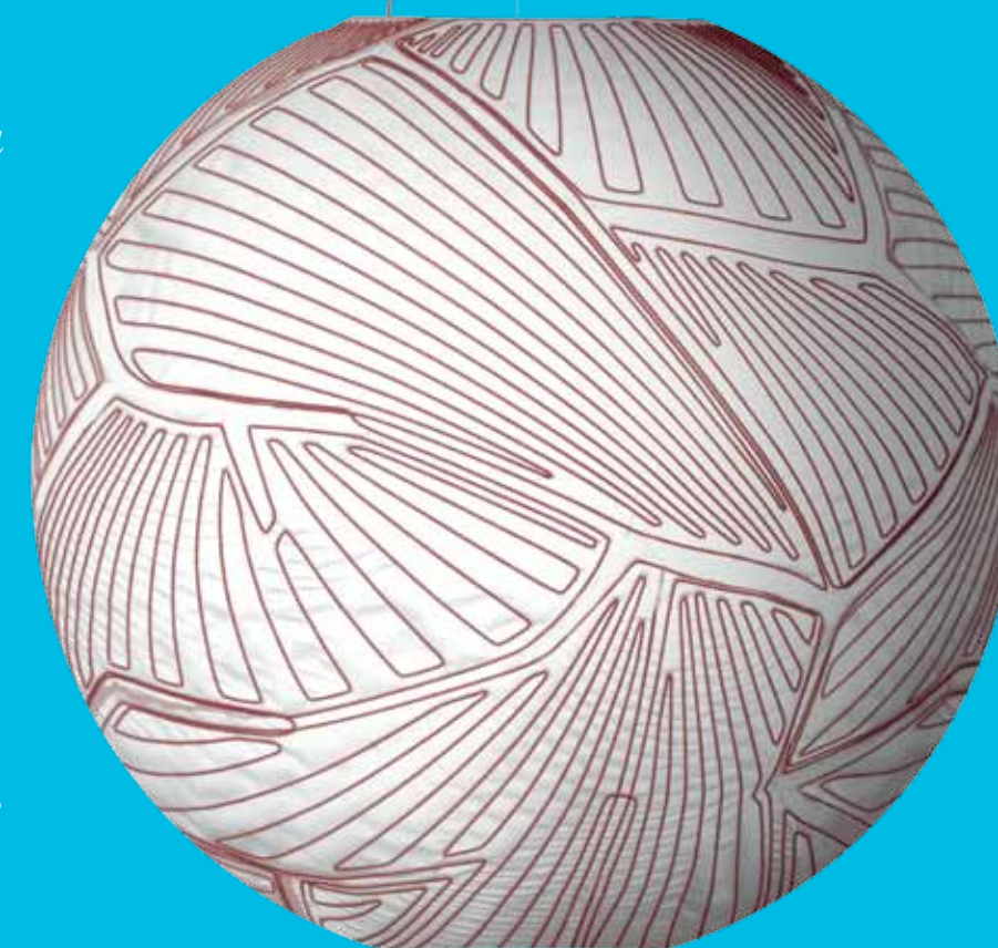
Luminária Planet, da Flos.